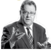
WALTER C. STEINBACH, PRÄSIDENT DER LANDESDIREKTION LEIPZIG

WIE AUS EINER INDUSTRIELANDSCHAFT EINE INDUSTRIEKULTURLANDSCHAFT WIRD, ZEIGT SICH IN SACHSEN. IM BRAUNKOHLEBERGBAUGEBIET „SÜDRAUM LEIPZIG“ HAT DANK EINES ÖKOLOGISCHEN PROGRAMMS UND UMWELTVERTRÄGLICHER ENERGIEGEWINNUNG DIE ZUKUNFT BEREITS BEGONNEN.